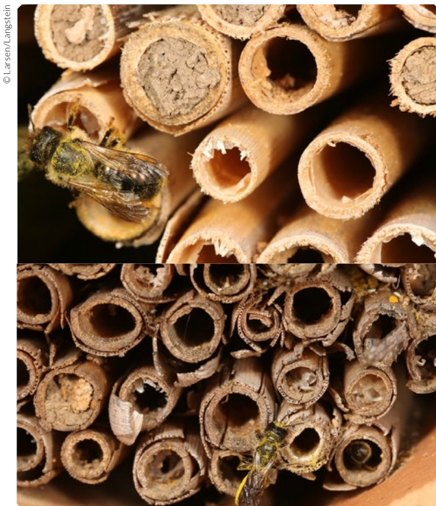
Sauber gesägte Schilfhalme (oben) werden sehr gut angenommen. Sind sie jedoch auf der Fluglochseite zersplittert (unten) oder zerfasert, werden sie deutlich seltener besiedelt.