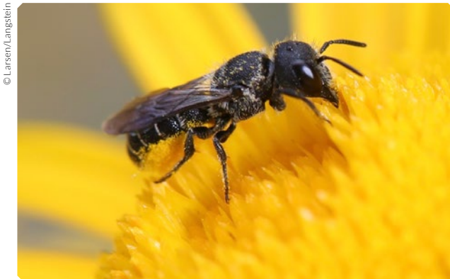
Wildbienen sammeln für ihre Brut Pollen. Häufig wird dieser, wie hier im Bild, auf der Unterseite des Hinterleibes gesammelt. Andere Arten transportieren ihn in Sammelkörbchen an den Hinterbeinen.