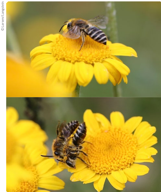
Ein paarungsbereites Weibchen der Seidenbiene wartet auf einer Blüte (oben). Bereits nach kurzer Zeit wird sie dank ihrer Pheromone von einem Männchen gefunden und es kommt zur Paarung (unten).