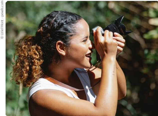
Nutzt Bilder zur Dokumentation eurer Ergebnisse

Stellt euer Forschungsprojekt mithilfe eines Videos anderen Schulklassen vor. Eure Videos werden über YouTube online gestellt, achtet daher darauf, dass auf dem Video keine Gesichter zu sehen sind! Die Dauer des Videos sollte nicht länger als zehn Minuten sein. Ihr könnt unterschiedliche Präsentationsformen (z. B. eine PowerPoint-Präsentation) verwenden. Um eure Videos interessant zu gestalten, solltet ihr auch Videos und Bilder zur Dokumentation eurer Beobachtungen an den Nisthilfen nutzen.