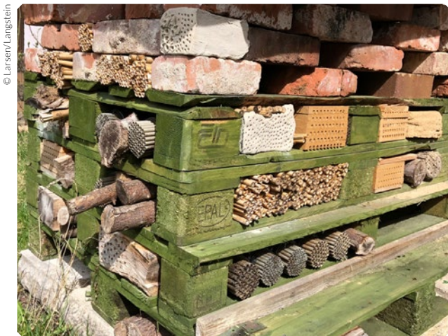
Beispiel für eine große Nisthilfe aus alten Paletten. Neben Pappröhrchen, Schilf, Bambus und anderen Halmen werden den Wildbienen hier auch ausgebohrte Gänge in Hartholz, Lehm und Ton als Nistgelegenheit angeboten. Eine hohe Artenvielfalt an Wildbienen lässt sich hier nach wenigen Jahren beobachten. Dies kann als Anregung für weitere Projekte in eurer Schule dienen.

Um einen gewissen Grad an Komplexität nicht zu überschreiten und um den Erkenntnisgewinn zu erhöhen, werden bei diesem Grundbauplan nur Stängel, Halme und Röhrchen verwendet. Auf Bohrungen in Hartholz oder Löcher in Lehm oder Ton wird daher ganz bewusst verzichtet.