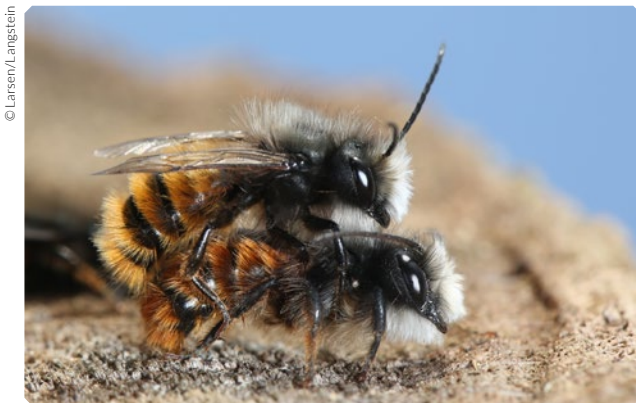
Mauerbienen bei der Paarung. Diese schön gemusterte, recht große Wildbiene ist ein häufiger Bewohner vieler Nisthilfen.

In der schützenden Hülle des Kokons überwintern die Mauerbienen. Mit den ersten wärmenden Sonnenstrahlen im folgenden Frühjahr durchbrechen die Mauerbienen ihre Brutzellen und schlüpfen. Die Männchen in den vorderen Zellen verlassen ihre Zellen zuerst und warten an den Nistplätzen auf die Weibchen, um sich mit ihnen zu paaren. Nach der Begattung sucht das Weibchen einen geeigneten Nistplatz, der meist in der Nähe ihres Geburtsortes liegt. Hat sie einen geeigneten Hohlraum gefunden, beginnt sie mit dessen Reinigung und der Zyklus beginnt von Neuem.