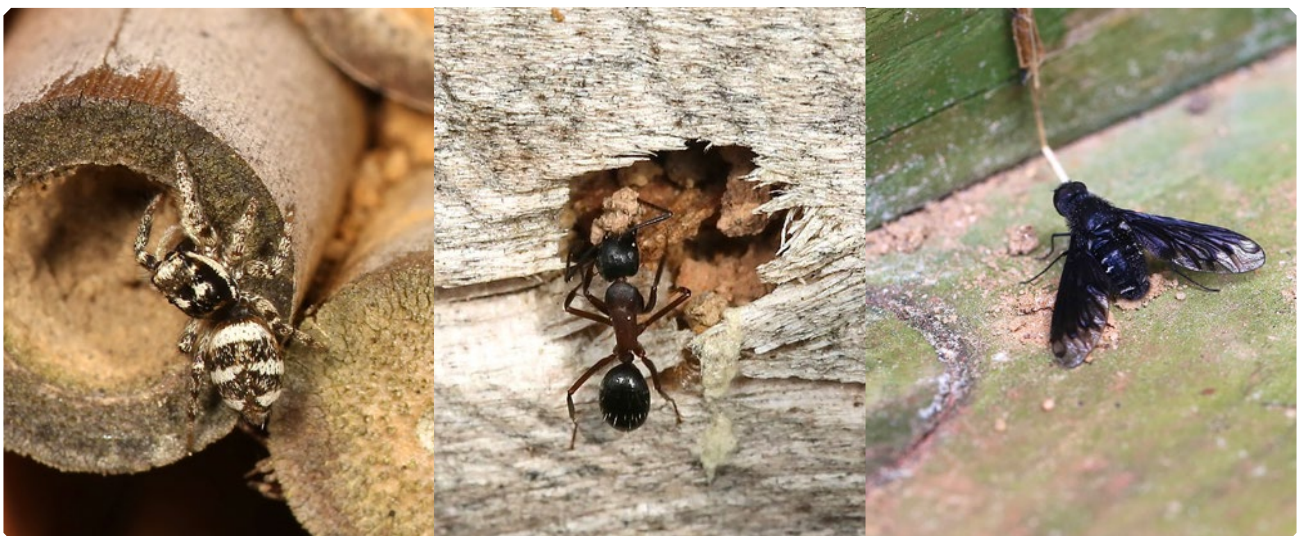
Neben Bienen und Wespen können auch andere Arthropoden an Nisthilfen beobachtet werden. Auf dem linken Bild sieht man eine Zebraspringspinne auf der Jagd nach kleinen Insekten. Das mittlere Bild zeigt eine Rossameise, die eine verschlossene Neströhre inspiziert und versucht zu öffnen. Im rechten Bild ist eine Trauerfliege zu sehen, deren Larven in Wildbienenestern schmarotzen.