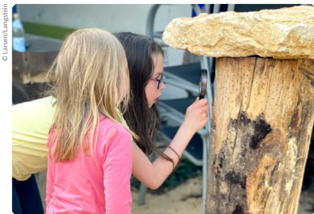
Schüler nehmen die Rolle von Forschern ein

In dem Forschungsprojekt soll über eine handlungsorientierte Auseinandersetzung in Verbindung mit naturwissenschaftlichen Arbeitsweisen ein Bezug zur Biene aufgebaut werden. Der abstrakte Begriff Nachhaltigkeit wird am Beispiel der Situation der Bienen greifbar und begreifbar. Absicht ist es, ausgehend von einer Problemorientierung eine Lernumgebung zu schaffen, in denen Lernende ihr Wissen selbstständig erwerben und vertiefen können.