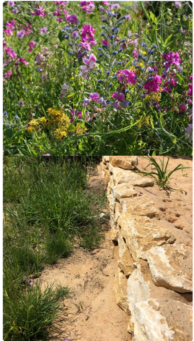
Eine große Vielfalt einheimischer Blütenpflanzen und offener, unbearbeiteter und besonnter Boden sind wichtige Voraussetzungen für viele Wildbienen.