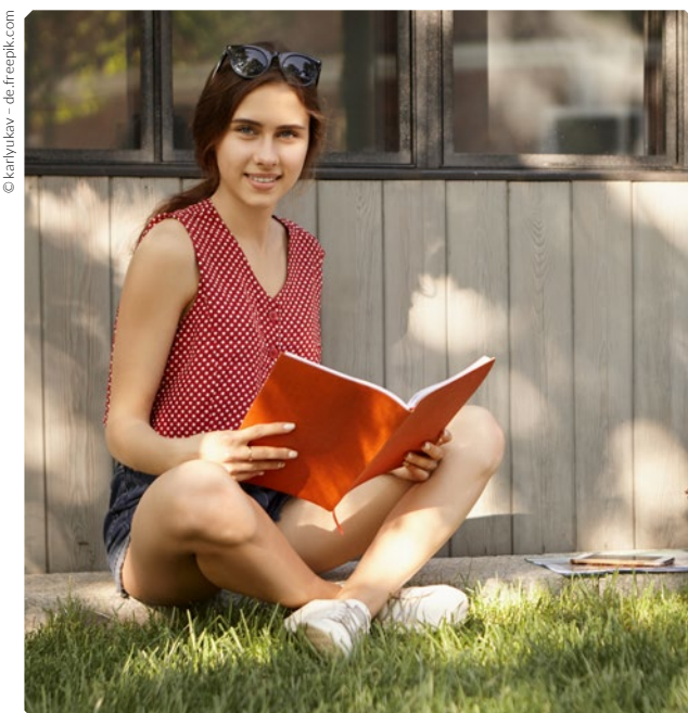
Der Ablaufplan des Projektes sollte in einem Laborbuch dokumentiert werden