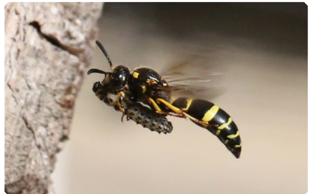
Die Brut solitärer Wespen benötigt tierische Nahrung. Je nach Art werden daher Raupen, Spinnen, Fliegen oder auch Blattläuse eingetragen.