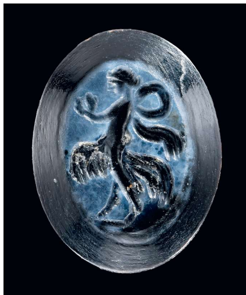
166 ◊ Neuenstadt a. K., Bau D. Römische Gemme mit Darstellung einer tanzenden Maenade. Zweilagenstein, Größe 1,1 cm × 1,6 m.

Aus demselben Gebäude bargen wir, wohl als Teil eines verlorenen Fingerrings, eine