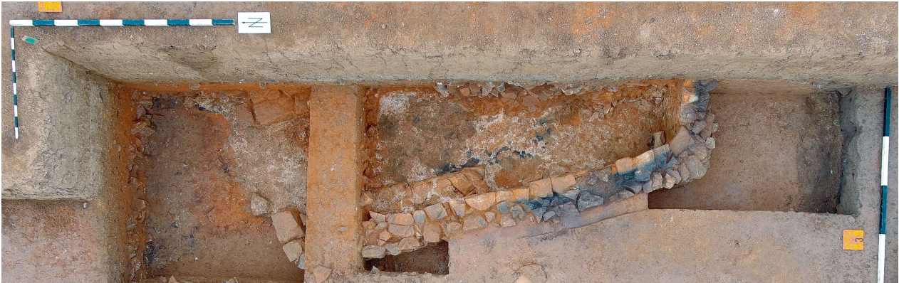
163 △ Neuenstadt a. K., Bau A. Westmauer des länglichen Kalkbrenn(?)Ofens mit den kurzen Mauerwangen der Schüröffnung an seiner Nordseite.

Eine Aufschüttung mit Estrichresten könnte jedoch auf eine besondere Hallenkonstruktion im südlichen Teil des Gebäudes deuten; aus einer daraus geborgenen Holzkohle erhielten wir durch die 14 C-Bestimmung eine Datierung in die Jahre 133–242 (AMS-Messung, kalibriertes Kalenderdatum mit 68 Prozent Wahrscheinlichkeit).