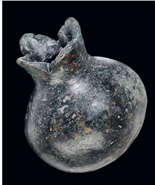
165 ◊ Neuenstadt a. K., Bau D. Granatapfel aus Buntmetall. Teil eines Möbelaufsatzes oder Geräts. H. ca. 6 cm.

Im Gebäude D spielten Granatäpfel auch in anderem Zusammenhang eine Rolle: Wir fanden die Nachbildung einer solchen Frucht aus Buntmetall, innen hohl und daher wohl zum Aufstecken auf einen anderen funktionalen oder dekorativen Gegenstand gedacht (Abb. 165). Granatäpfel wurden in der Antike auf profanen und sakralen