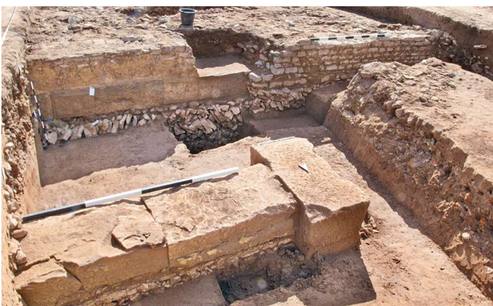
164 ▽ Neuenstadt a. K., Bau D. Hinten links im Bild die Nordmauer, rechts die Hof- oder Gartenmauer, im Vordergrund die monumentalen Sandsteinblöcke der Portikus/Arkade.

Innerhalb der Schuttfläche von Gebäude A wurde der Brennraum eines Ofens mit steinernen Wänden angeschnitten (Abb. 163). Spuren von Kohle und Kalk könnten auf einen Kalkbrennofen deuten. Die genaue Datierung des Ofens steht noch aus.