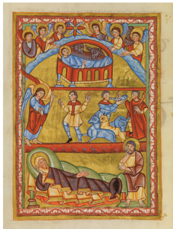
Miniatur zum Weihnachtsfest aus dem Ellenhard-Sakramentar Freising(?) vor 1056 | Staatsbibliothek Bamberg, Msc.Lit.2, Bl. 16v