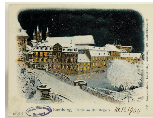
Nachtschneekarte: Bamberg, Partie an der Regnitz. Nürnberg, Kunstverlag Hermann Martin, 1900 | Staatsbibliothek Bamberg, MvO A VI 395