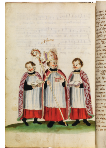
Seltene Bildzeugnis des an mittelalterlichen Dom-, Stifts- und Klosterschulen an Festtagen um die Weihnachtszeit gewählten Kinderbischofs in einem Festkalender aus dem Kollegiatstift St. Stefan. Bamberg, Ende 16. Jh. | Staatsbibliothek Bamberg, HV.Msc.476, Bl. 251v