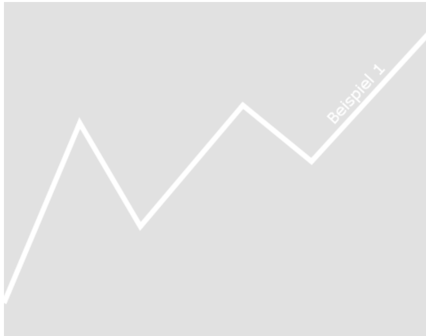
Abbildung 1.1: Beispiel 1 zum Einfügen einer Grafik

enim eleifend felis pretium feugiat. Vivamus quis mi. Phasellus a est. Phasellus magna. In hac habitasse platea dictumst. Curabitur at lacus ac velit ornare lobortis. Curabitur a felis in nunc fringilla tristique.