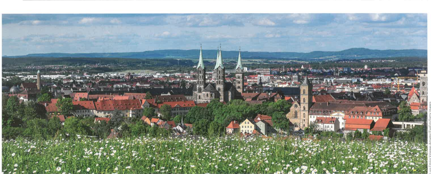
Erhabenes Bauwerk: Der Dom wacht über die Stadt. Hier befindet sich das einzige erhaltene Papstgrab nördlich der Alpen. A grand building: the cathedral watches over the city. It is home to the only preserved papal tomb north of the Alps.

D Blüten, nicht die gleich langen Halme.“ Beispiele: Iranistik, Europäische Ethnologie, Denkmalpflege. Historische Fächer genießen zudem hohes Renommee. Als „starkes Feld“ sieht Ruppert auch die Sozialwissenschaften im weitesten Sinne. Ein Leibniz-Institut für Bildungsverläufe siedelte sich an. In dem Projekt Nationales Bildungspanel (NEPS) untersuchen die Wissenschaftler Bildungsverläufe Zehntausender Menschen und gehören damit in die erste Liga der empirischen Bildungsforschung. Medizin, Ingenieur-fächer oder Jura gibt es in Bamberg dagegen nicht.