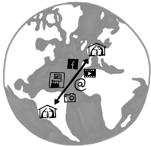
Abb. 1: Virtueller Schulgartenaustausch