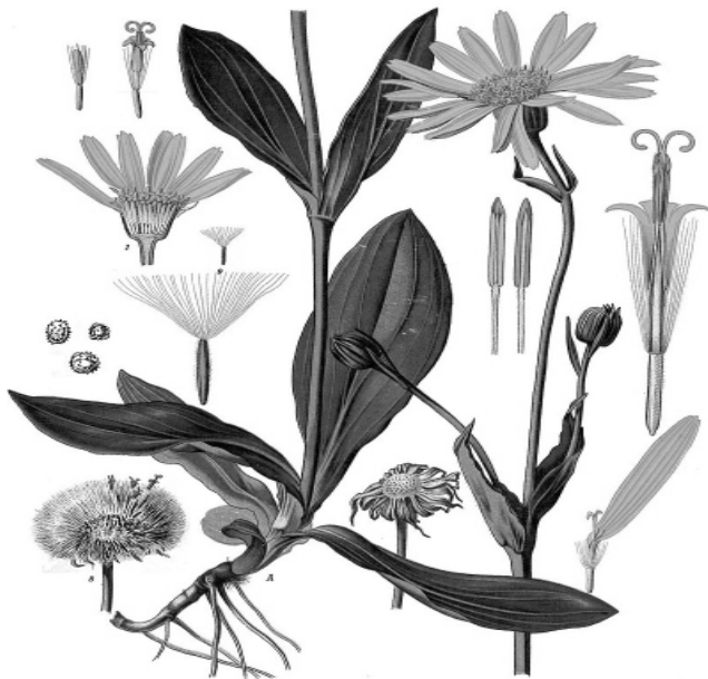
Abb. 2: Arnika

Schnell griffen bayerische Gemüse-Gärtner:innen die Idee auf und produzierten erwerbsmäßig. Mittlerweile gibt es Ingweranbau auf kleinen Flächen in Bio-Gärtner:innen beispielsweise in Nordhessen in Witzenhausen oder am Diemelsee, in Mecklenburg-Vorpommern oder am Bodensee. Das ist großartig: frischer, faserarmer Ingwer als neue Einkommensquelle, im Handel ohne lange Transportwege, als neue Fruchtfolgekultur im Gemüsebau. Die Verkaufspreise liegen bei 18€/kg und höher. Ein großer Teil des Erlöses verbleibt wirklich bei den Produzent:innen. Ingwer ist also ein Produkt ohne Nachteile? Das ist nicht ganz klar. Zwar nimmt Ingweranbau in Deutschland gerade richtig Fahrt auf, aber es fehlt noch an pflanzenbaulichen Erfahrungen. Bisher gedeiht er vor allem in Gewächshäusern mit Heizung und Bewässerung. Die Frage, ob dies in der Klimabilanz besser ist als der lange Transport von China oder Peru per Schiffscontainer, bleibt zu klären. Und es kommt schon jetzt zum Preiskampf unter den Produzent:innen. Das sind dann wieder politische und soziale Fragen: Ingwer ist eine arbeitsintensive Kultur, unter welchen Bedingungen wird er hierzulande geerntet? Werden billige Saisonarbeitskräfte dafür eingesetzt? Haben diese kleinen Mengen aus Deutschland einen Einfluss auf den Markt? Was bedeutet es für die Produktion in Peru, wenn wir hier Ingwer anbauen?