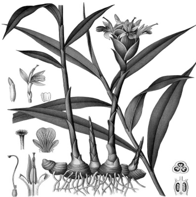
Abb. 1: Echter Ingwer