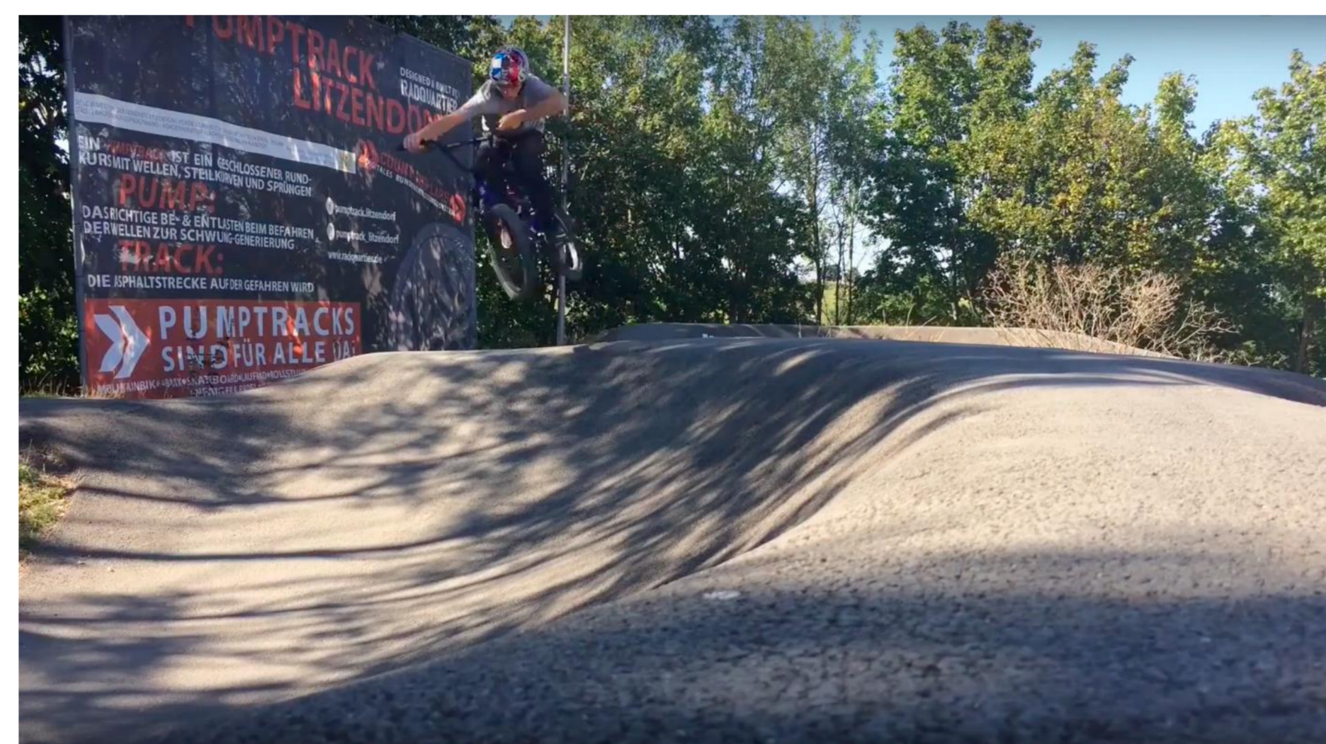
Bild 4: Ein/e Biker:in macht einen Whip über einen Beton-Hügel am Litzendorfer Pumptrack. Der Großteil springender Biker_innen fährt MTB's, dennoch fahren auch BMXer am Pumptrack.