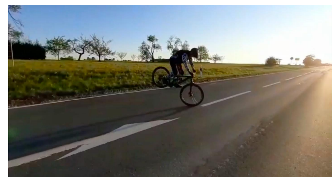
Bild 3: "Ein Stoppie 180" auf der Landstraße zwischen Litzendorf und Schammelsdorf. Die Darstellung ihres sportlichen Könnens und die Verbreitung über soziale Medien geschieht auch unter ästhetischen Kriterien."