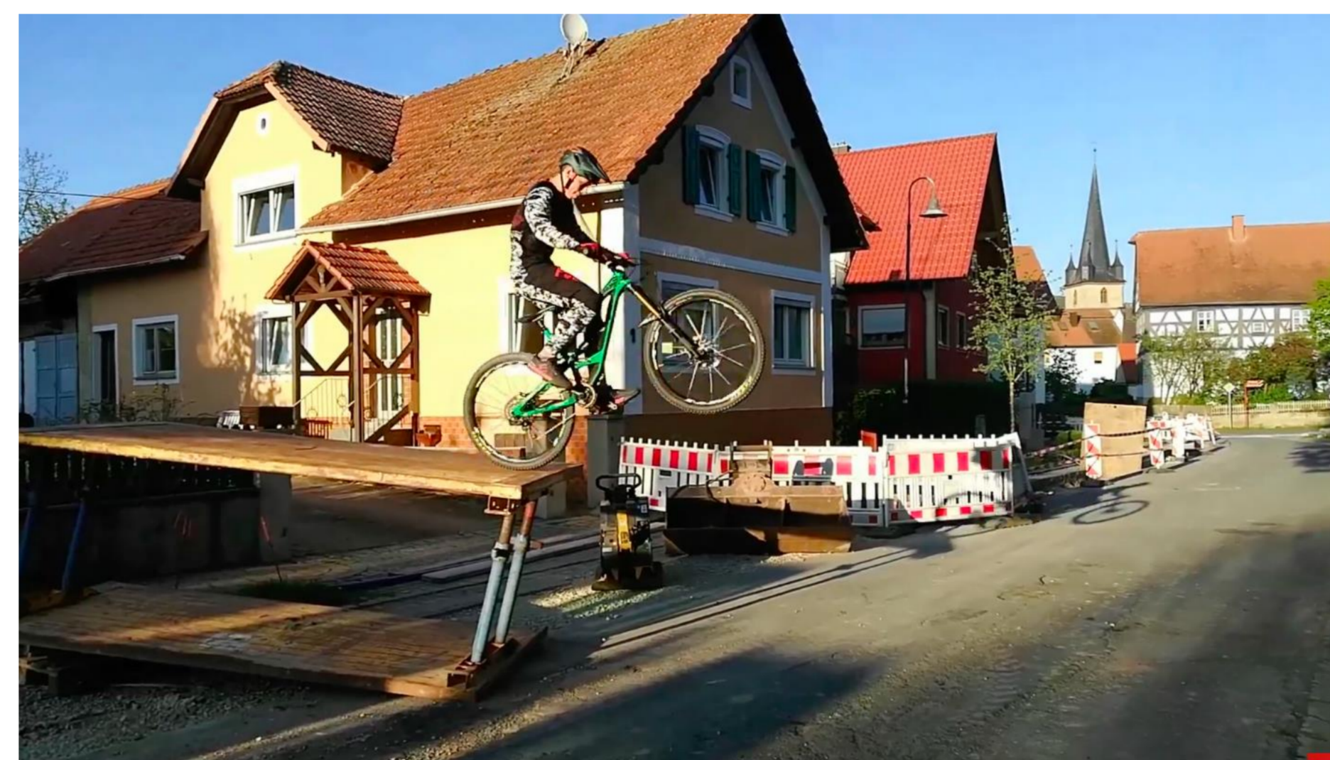
Bild 5: Treppenstufen, Betonblöcke und auch Baustellen - überall werden Möglichkeiten gesucht, um sich sportlich zu betätigen: Grenzen - körperliche als auch gesetzliche - werden ständig ausgelotet.