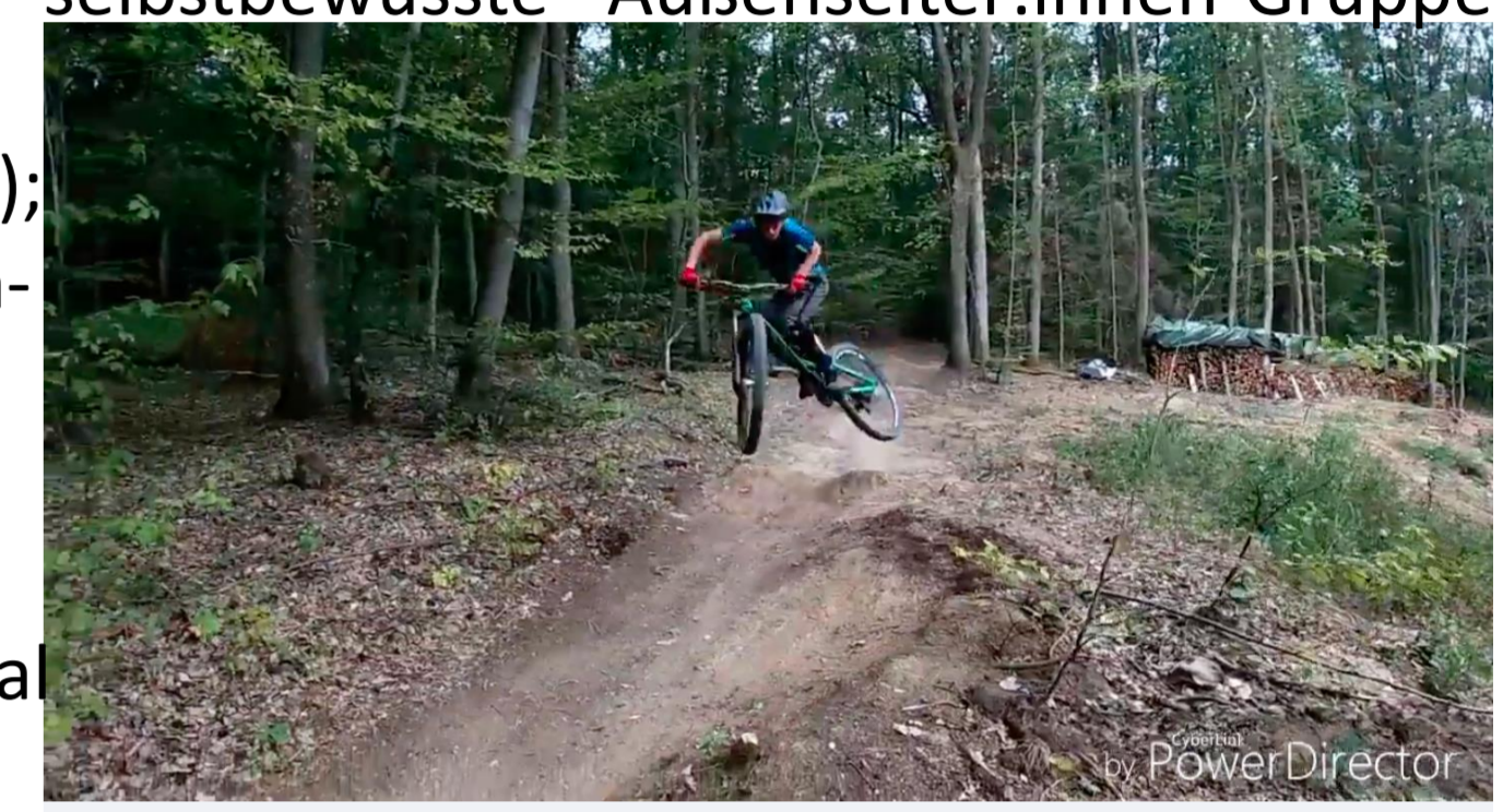
Bild 6: Ein Biker fährt auf einem (illegalen) Trail. Die häufige Nutzung dieser selbstgebauten Strecken ruft oft Konflikte mit örtlichen Autoritäten hervor.