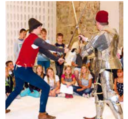
Schulprojekt beim Mittelalterfest 2018: Kinder bestaunen Schwertkampftechniken.

Ein Beispiel für die Schnittstelle zwischen Wissenschaft und Öffentlichkeit ist das ArchaeoCentrum bayern-böhmen im Geschichtspark Bärnau-Tachov. Das Zentrum in der deutsch-tschechischen Grenzregion erschließt Kultur- und Naturerbe und macht es einer breiten Öffentlichkeit zugänglich. Lebendig wird das Mittelalter auch in Zusammenarbeit mit Schulen, wo Kinder spielerisch Literatur und Sprache des Mittelalters