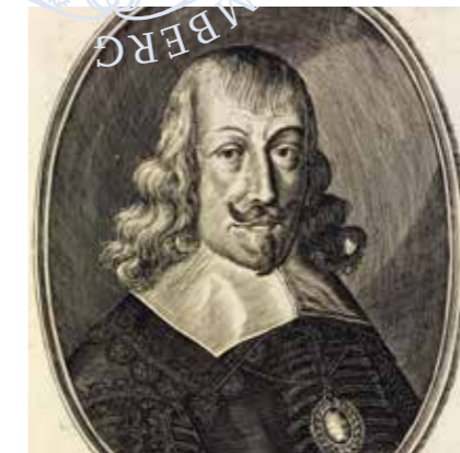
Universitätsgründer Fürstbischof Melchior Otto Voit von Salzburg

Umfassende Bildung im Sinne Ottos Voit von Salzburg braucht, davon sind wir überzeugt, Zeit und Freiraum: für Ideen, Diskussionen oder Visionen, aber auch für Erlebnisse, Erfahrungen oder Reifungsprozesse. Ein ganzheitliches Verstehen von Welt und Menschsein im humanistischen Sinn entsteht nicht linear. Manchmal braucht es den Mut, etwas Unabsehbares zu wagen oder Fehler zuzulassen, um einen Schritt nach vorne machen zu können. An etwas Bestehendem zu zweifeln, wie beispielsweise an der Wahl seines Studienfaches, ist daher nichts Verwerfliches, sondern Teil eines persönlichen Entwicklungsprozesses, den wir unserem Selbstverständnis gemäß bestmöglich begleiten und unterstützen.