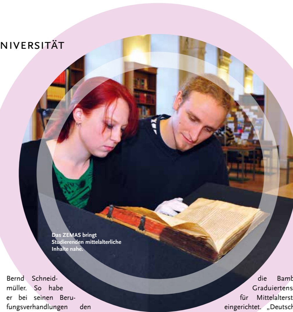
Das ZEMAS bringt Studierenden mittelalterliche Inhalte nahe.