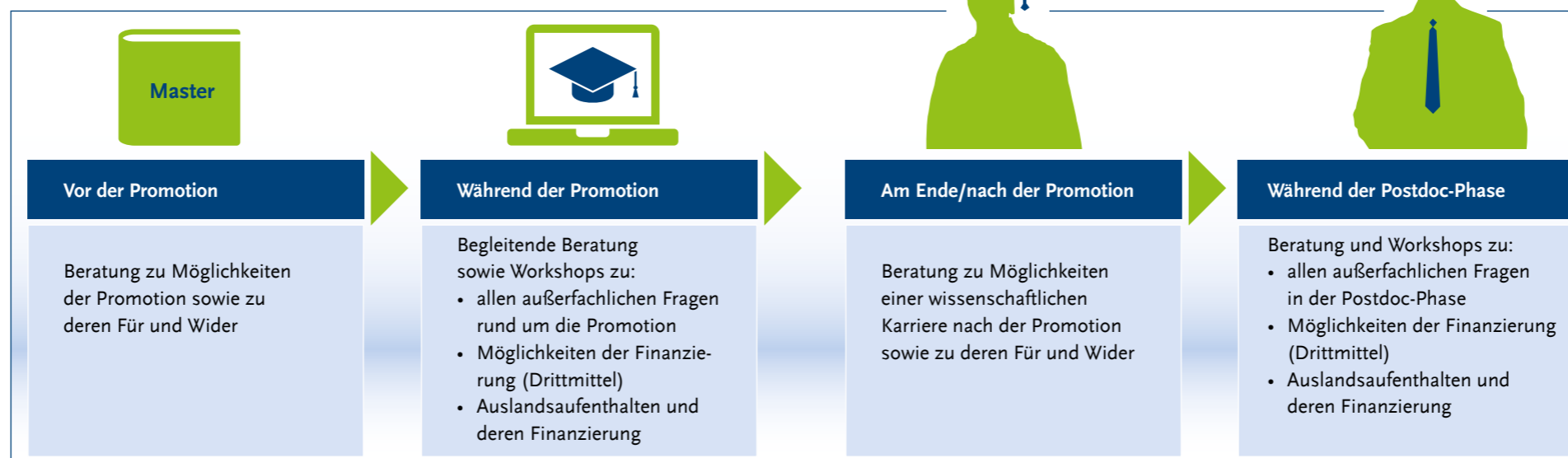
Angebote der Trimberg Research Academy (TRAc) für wissenschaftlichen Nachwuchs.