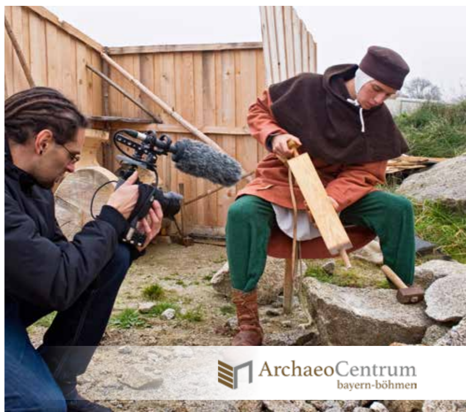
Im ArchaeoCentrum bayern-böhmen finden Dreharbeiten für die Multimedia-Reportage des Forschungsschwerpunkts Erschließung und Erhalt von Kulturgut statt.

Zunächst stellt sich die Frage: Wofür braucht eine Universität ein Forschungsprofil? Es schafft Klarheit über ihre Stärken. Ministerien und Drittmittelgeber erwarten in Anträgen, die für Projekte gestellt werden, auch Aussagen zum Forschungsprofil der Universität. Unternehmen suchen für Kooperationen Universitäten, deren Stärken zum eigenen Vorhaben passen. Sie und alle anderen sehen auf einen Blick, wofür die Universität Bamberg in besonderer Weise steht. Wissenschaftlerinnen und Wissenschaftlern erleichtert es die Einwerbung von Mitteln, Forschende anderer Universitäten zieht es in die Domstadt. „Das Forschungsprofil weist