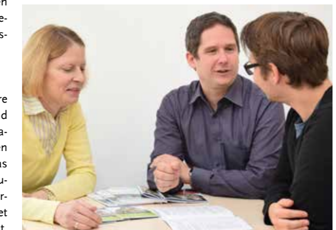
Erste Anlaufstelle bei Zweifeln am Studium ist die Zentrale Studienberatung.