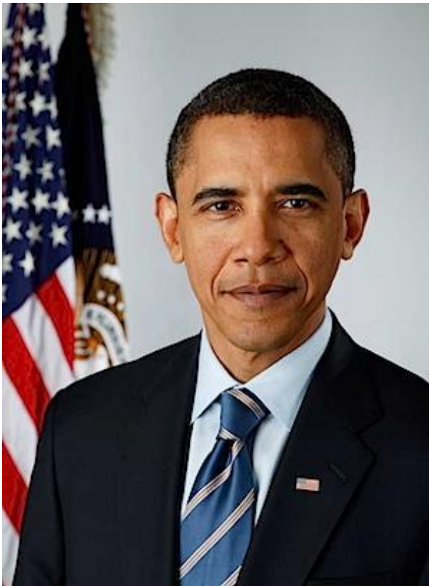
Präsident Barack Obama