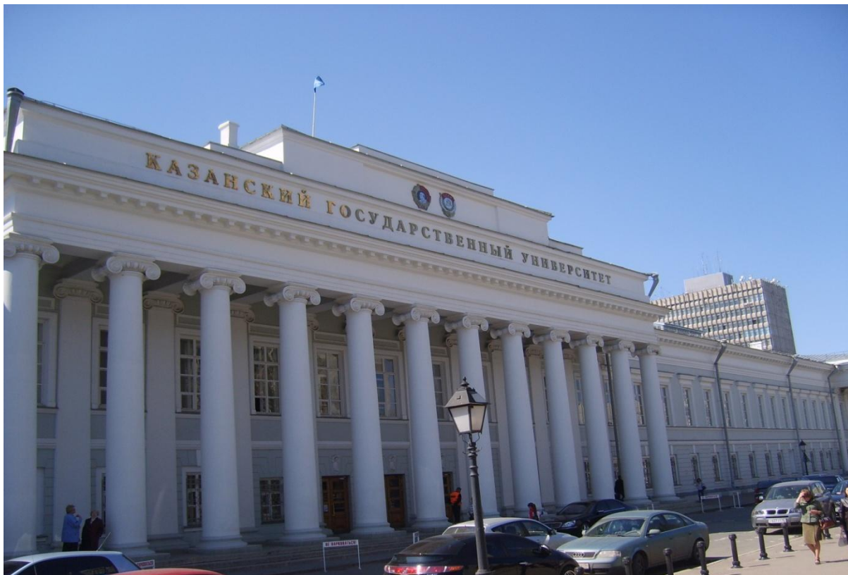
Hauptgebäude der Universität Kasan

öffnete ich die Tür, aber der Leiter des Auslandsamtes war leider gerade beschäftigt, deshalb sollte ich eine Weile warten. Als ich ihm die aus Bamberg mitgebrachten Unterlagen und den Brief von Herrn Dr. Weihe vorlegte und über die neuen Möglichkeiten sowohl für Studierende, als auch für Dozenten beider Universitäten referierte, die diese Partnerschaft mit sich bringen würde, sah mich der Kasaner Auslandsamtsleiter skeptisch an. Er erwiderte schließlich, dass die Universität Kasan bisher keine Kontakte mit Bamberg hätte, dass es schwierig sei, eine Partnerschaft „auf einem leerem Platz“ herzustellen und dass erst mal einzelne Kontakte angeknüpft werden müssten.