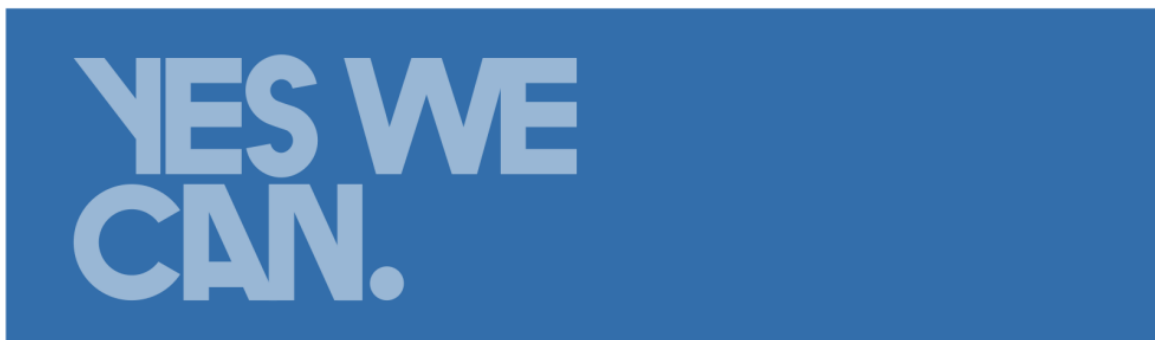
Obama Wahl 2008