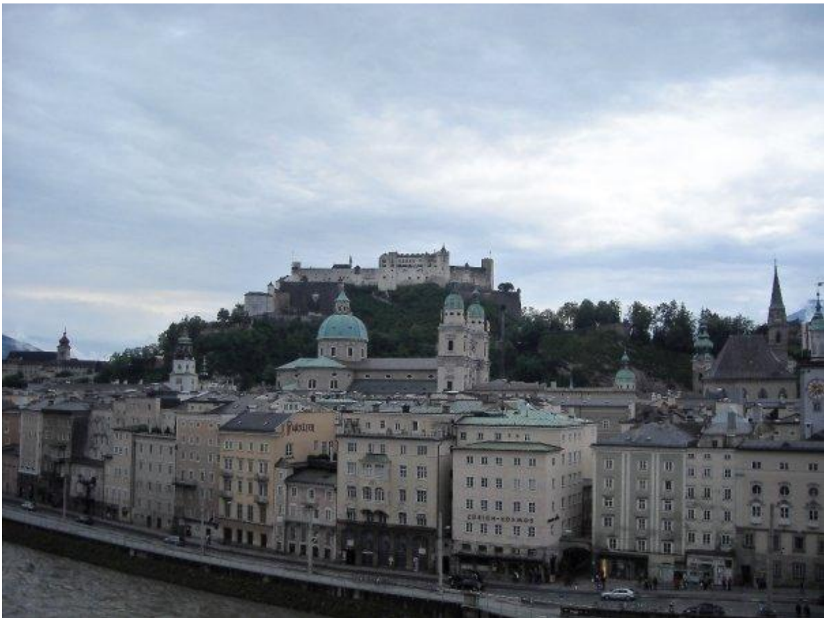
Blick auf Salzburg