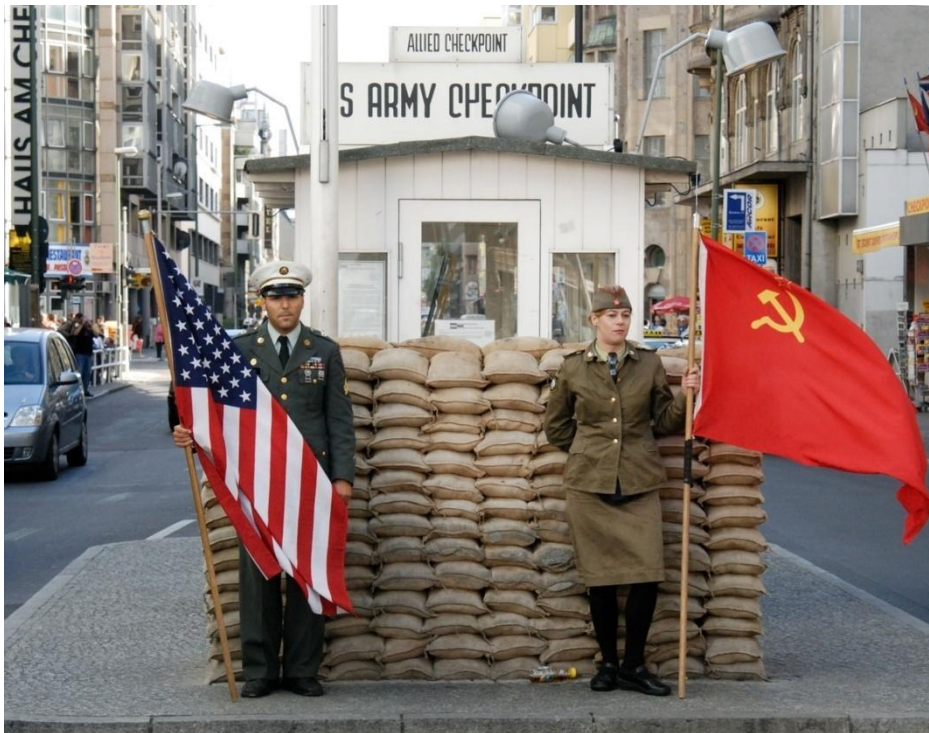
Checkpoint Charlie – früher zwischen amerikanischen und russischem Sektor!

Trotz der vielen Sehenswürdigkeiten, die ich hier in Deutschland besucht habe, war Berlin die beste Stadt, die ich bis jetzt besucht habe. Natürlich gibt es wunderschöne alte Kirchen in Berlin, die mir so gut gefallen hatten. Aber meiner Meinung nach ist Berlin die interessanteste Stadt die ich besucht habe, weil so viel wichtige Geschichte an diesem Ort geschrieben wurde.