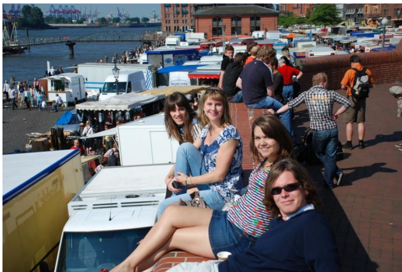
Sonnenbad in Hamburg

Wir waren zu fünft. Eine spaßige Gruppe, zwei Studenten aus Polen, eine aus Ungarn, eine aus Großbritannien, und ich, aus Amerika. Es war ein langes Wochenende, Donnerstag und Freitag hatten wir frei von der Uni, so dass unsere Reise am Donnerstagmorgen anfang. Was hatten wir vor? Donnerstag wollten wir nach Bremen, Freitag nach Cuxhaven, Samstag und Sonntag nach Hamburg. Die lange Fahrt und die Zeit im Auto waren an sich ganz schön. Die Häuser, die Landschaft und die Stimmung änderten sich in verschiedenen Orten in Deutschland, was sehr schön zu sehen war. Als wir im Bremen ankamen, waren wir alle schon bereit zu Fuß zu laufen. Die Stadt war wunderschön. Es gibt so viele alte Architektur und Geschichte in Bremen, und das Studentenviertel war ganz lebendig. Wir sind herum gelaufen und haben den Tag wirklich genossen.