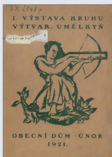
Ausstellungskatalog der 1. Ausstellung des Vereins Bildender Künstlerinnen (KVU) (Februar 1921), Gemeindehaus