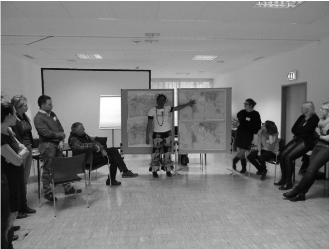
...und anschließend werden die Weltkarten vor der Gruppe präsentiert. Die globalen Vernetzungen der Personen werden gut sichtbar.

ten zu Flucht und Migration lieferte sie einen ersten thematischen Input. Der von angeregten Diskussionen geprägte Vortrag offenbarte den Zuhörer/-innen interessante neue Perspektiven und Informationen zur aktuellen Flüchtlingsthematik.