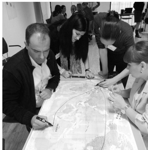
In Kleingruppen wird auf der Weltkarte eingezeichnet, zu welchen Ländern man sich verbunden fühlt...