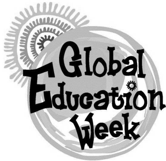
Logo Globale Education Week; Quelle: North-South Centre of the Council of Europe

Weitere Angebote gab es zudem in Form eines interaktiven Workshops, der von dem Verein Freunde der Erziehungskunst Rudolf Steiners e.V. in Baden-Württemberg angeboten wurde. Unter dem Titel „Youth Leadership – Wandelgestalter