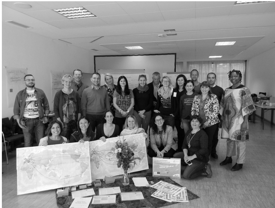
Die Workshop-Gruppe mit Teilnehmer/innen aus der Türkei, Griechenland, Portugal, Norwegen, Zypern, den Niederlanden, Rumänien, Österreich, Italien, Georgien, Litauen, Belgien und Spanien

Sarah Maringer suedwind.wien@suedwind.at