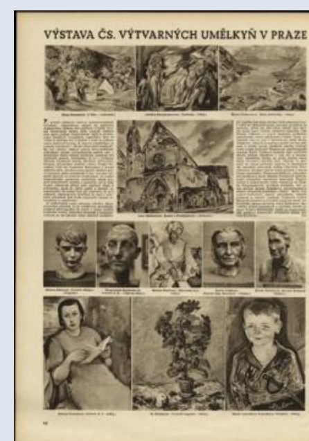
Ausstellungsrezension des KVU in der Zeitschrift Pestrý týden 12/18 (01.05.1937), S. 12